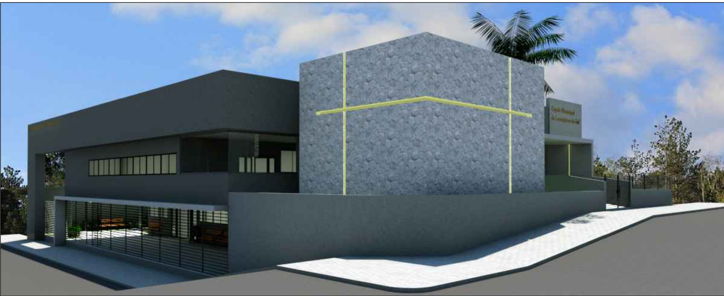
IMAGEM SEM ESCALA