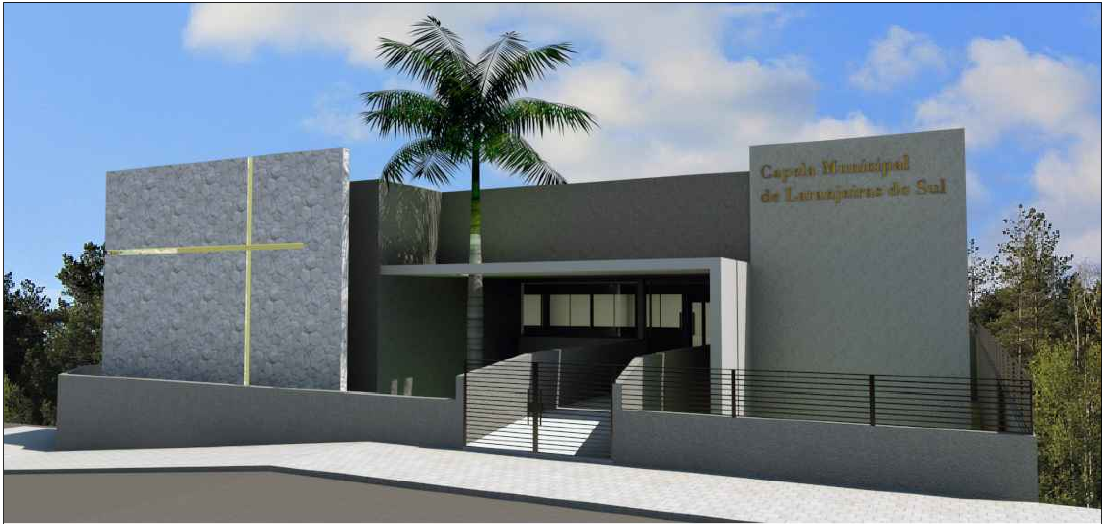
IMAGEM FRONTAL SEM ESCALA